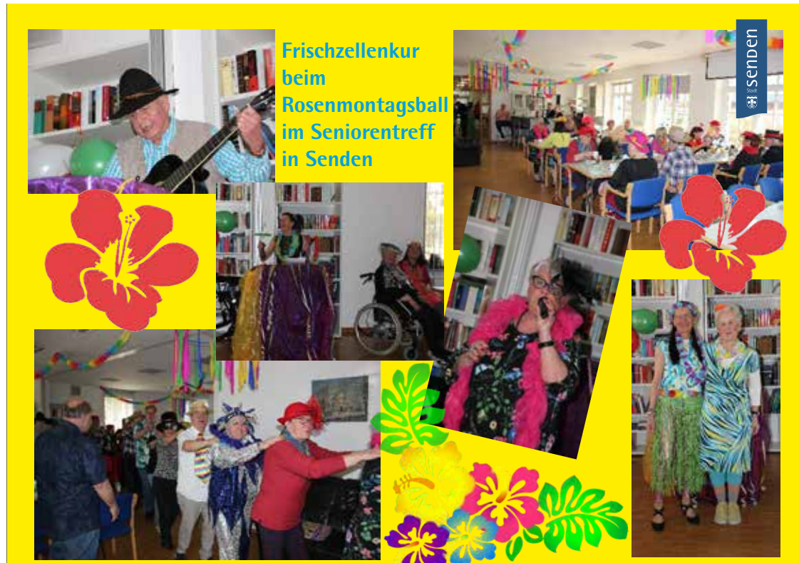
Frischzellenkur beim Rosenmontagsball im Seniorentreff in Senden

Im fast ausverkauften Therese-Studer-Haus feierten junge und junggebliebene Senioren Rosenmontag. Bei abwechslungsreicher Musik ließen sich die Gäste des Seniorentreffs nicht lange bitten und zogen in der Polonäse durchs Haus, schunkelten, sangen und tanzten.